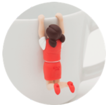
▲たれさがりフチ子