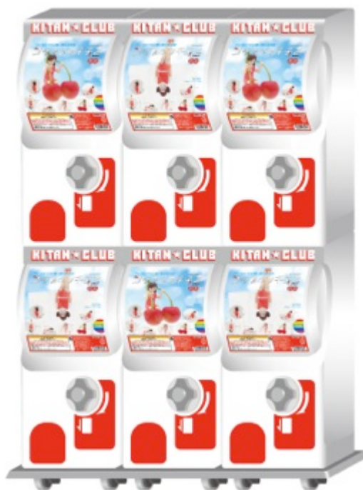
▲カプセル自動販売機イメージ

ストラップでもない、マグネットでもない「フチ」で「遊ぶ」新感覚シチュエーションフィギュア「コップのフチ子」。2012年7月の発売より、SNSを中心に口コミで広がりを見せ大きな話題となり、現在ではシリーズ累計440万を超えている大人気のカプセルトイ。現在では商品化、書籍化、映像化など、あの大人気アニメ「魔法少女まどか☆マギカ」とのキャラクターコラボまで実現し、カプセルトイの枠を遥かに超えた展開をみせている。