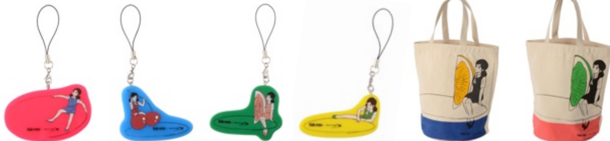
▲アクリルアクセサリー ストラップ 各¥1,890(税込)