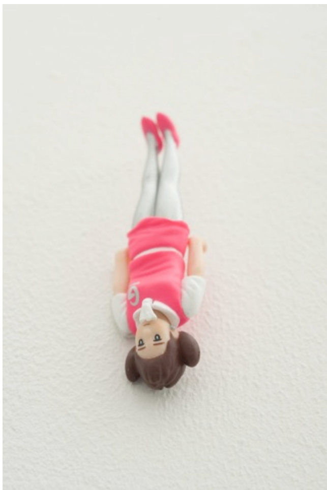
▲GINZAのフチ子 サンプル