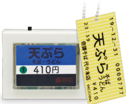
▲天ぷらそば・うどん