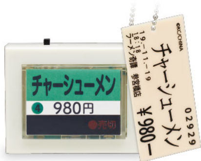
▲チャーシューメン