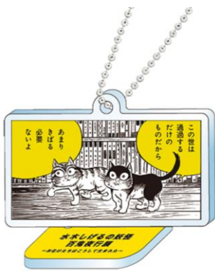
▲あまりきばる必要ないよ