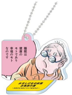
▲睡眠は幸福のモト