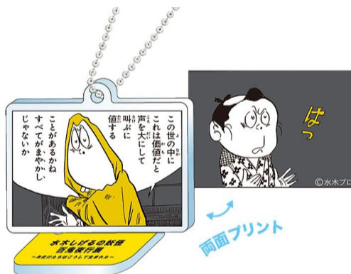
▲すべてがまやかしじゃないか